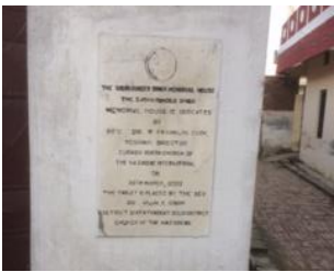
foto 85 en 86 geboortehuis van Sadhu Sunder Singh