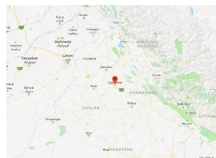
Figuur 4 Ludhiana