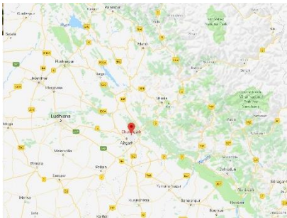
Figuur 3 Chandagarh