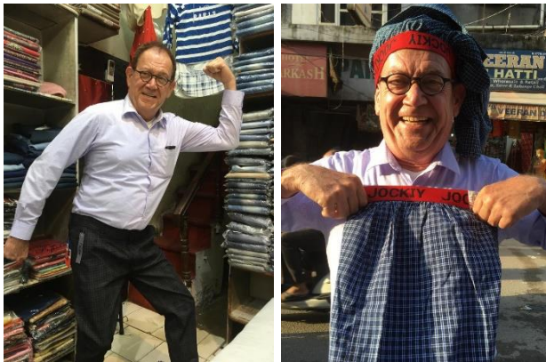
Foto 79 en 80 kleding kopen op de markt in Ambala