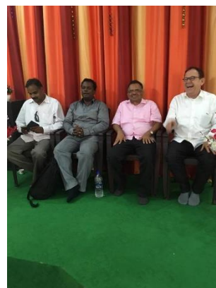
foto 83 altijd plezier