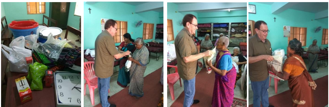
foto 98, 99, 100 en 101 cadeautjes voor de weduwen