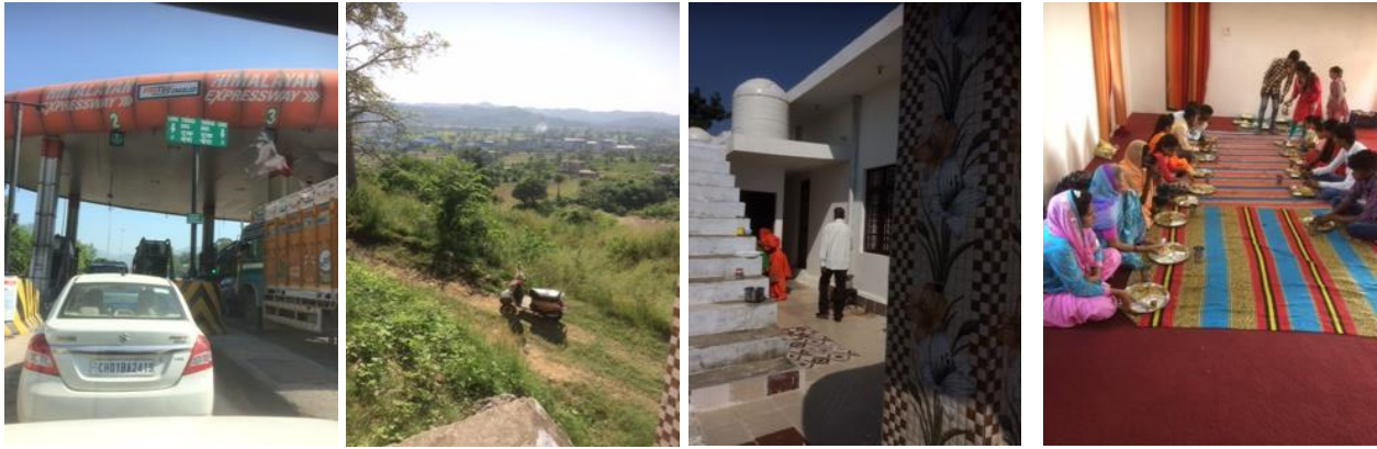
foto 87, 88, 89 en 90 via de tolweg en tenslotte een karrespoor naar het kerkje in Nalagarh