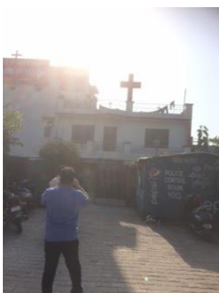
foto 84 gedenkteken voor de vermoorde pastor