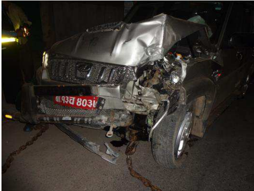
Wij zijn dankbaar dat iedereen levend uit de auto is gekomen.