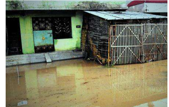
Eén van de huizen die hersteld gaat worden.