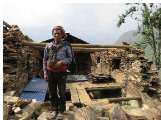
Foto: Man uit Dhading voor zijn huis