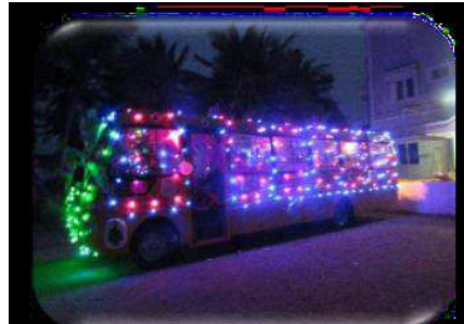
Foto: Schoolbus GNFM met lichtjes

Met kerst was het een bijzonder feest in Periyampatti. De grootste schoolbus werd versierd met lichtjes en vanuit de bus klonk muziek. De kinderen gingen uit hun dak.