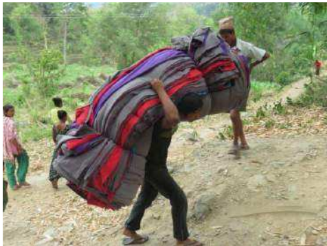
Foto: man met dekens in Kabre