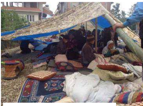
Foto: Gezin in tent

Hij heeft hiermee eerste hulp en noodrantsoenen en benodigheden kunnen brengen naar gebieden zoals Yiamdi in het Kabre district, Dhading, Naja Saghu en Gumi in het Gorkha district waar de reguliere hulpverlening niet zo gauw komt. Op het moment leven de getroffen Nepalezen in tenten.