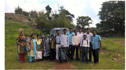
De studenten op missie bij de heuvelstammen