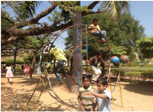
De kinderen uit het hostel zijn een dagje uit in de speeltuin